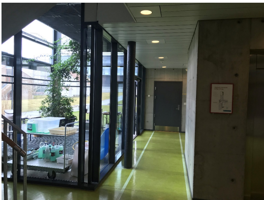
Bilde 2.8: Korridor og dør inn til biologilab (K-003) fra hoveddør

brannvesenet og avlyste utrykningen. Elever var da på vei inn i laboratoriet for å hente sakene sine. De ble nektet av Statsbygg å gå inn i det røykfylte laboratoriet.