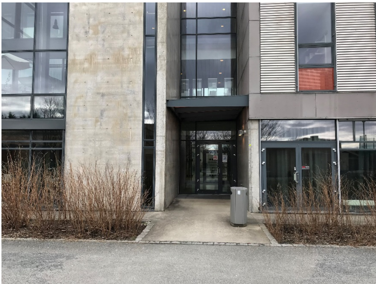
Bilde 2.7: Hoveddør ved biologilaben

Da de to fra Statsbygg kom ned til HL-huset var det samlet en del mennesker i hesteskoen på fremsiden av bygget. Det var også brannvernkontakter med refleksevest som organiserte evakueringen av bygget. De to fra Statsbygg gikk deretter ned til sørsiden av bygget, til hoveddør ved biologilaben (se bilde 2.7).