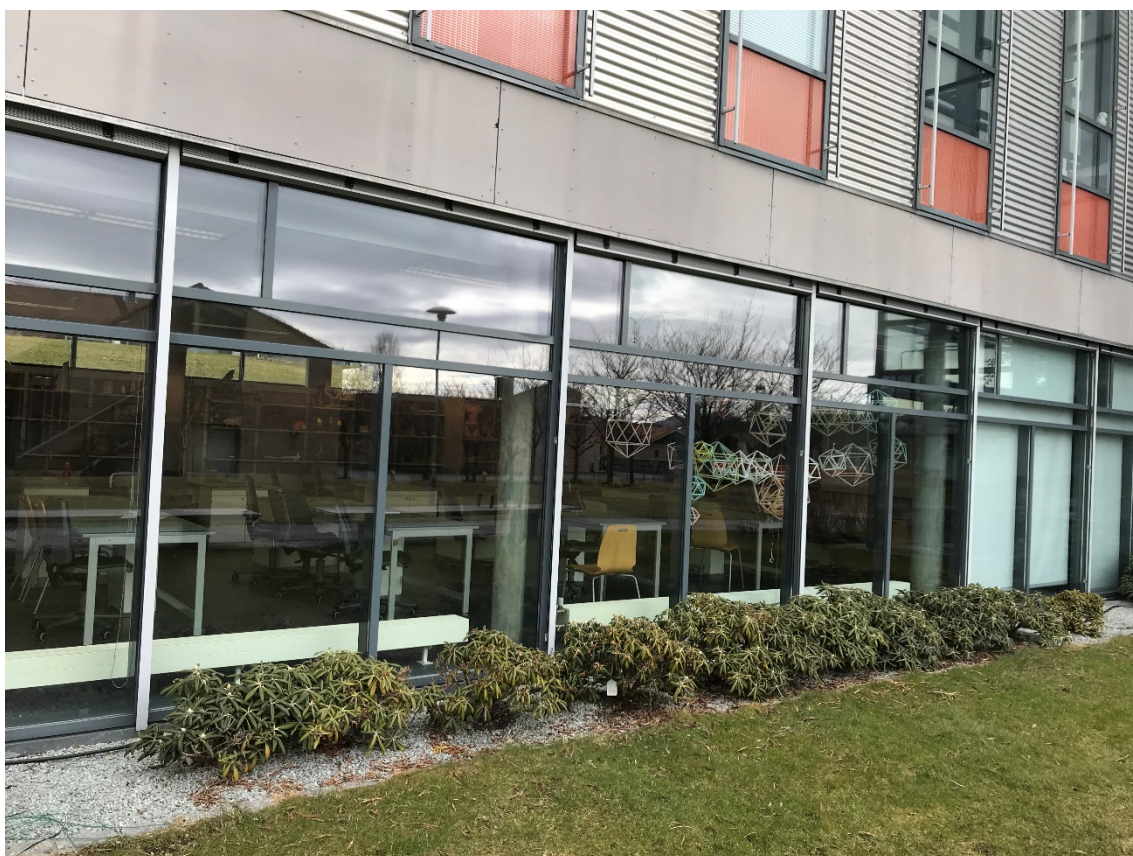
Bilde 1.1: Biologilab K-003 sett fra utsiden

Tilstede i laboratoriet var 21 elever fra Forskerlinjen på St. Olav videregående skole, en faglærer fra St. Olav og faglærer fra UiS.