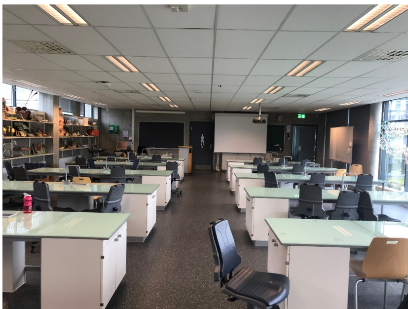
Bilde 2.1: Biologilab K-003, sett fra bakerst i rommet frem mot tavle og utgangsdør

TN 102 hadde en av sine ordinære undervisningsdager tirsdag 16. januar 2018. Undervisningen foregår i biologilaben K-003 i Hagbard Line-huset (HL), som har vært tilholdssted for kurset siden det startet i 2012. Studentene blir busset fra St. Olav og ankommer UiS like før kl. 12.00. Utgangsdøren til korridoren er fremst i klasserommet, ved siden av tavlen. I rommet er det 12 arbeidspulter hver med plass til tre personer. Bak i rommet er en nødutgang som går ut fra ytre vegg.