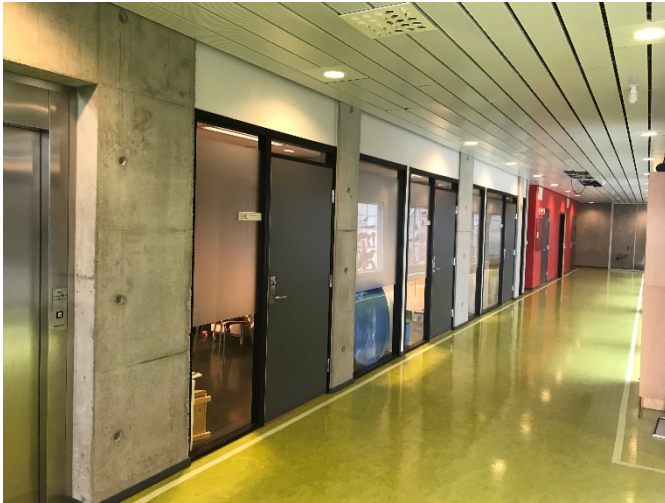
Bilde 2.6: Korridor ned til rødt felt med toalettene

I henhold til de to faglærerne (St. Olav og UiS) organiserte de seg slik at faglærer St. Olav tok ansvar for elevene, mens faglærer UiS skulle få kontroll i laboratoriet. Jentene som stod nærmest hendelsen kom seg raskt ut, og fant etter hvert frem til toalettene i en sidekorridor og fikk sjekket sine skader der.