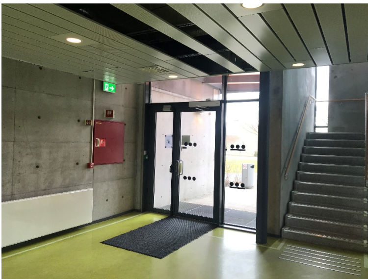
Bilde 2.5: Hoveddør ved biologilaben