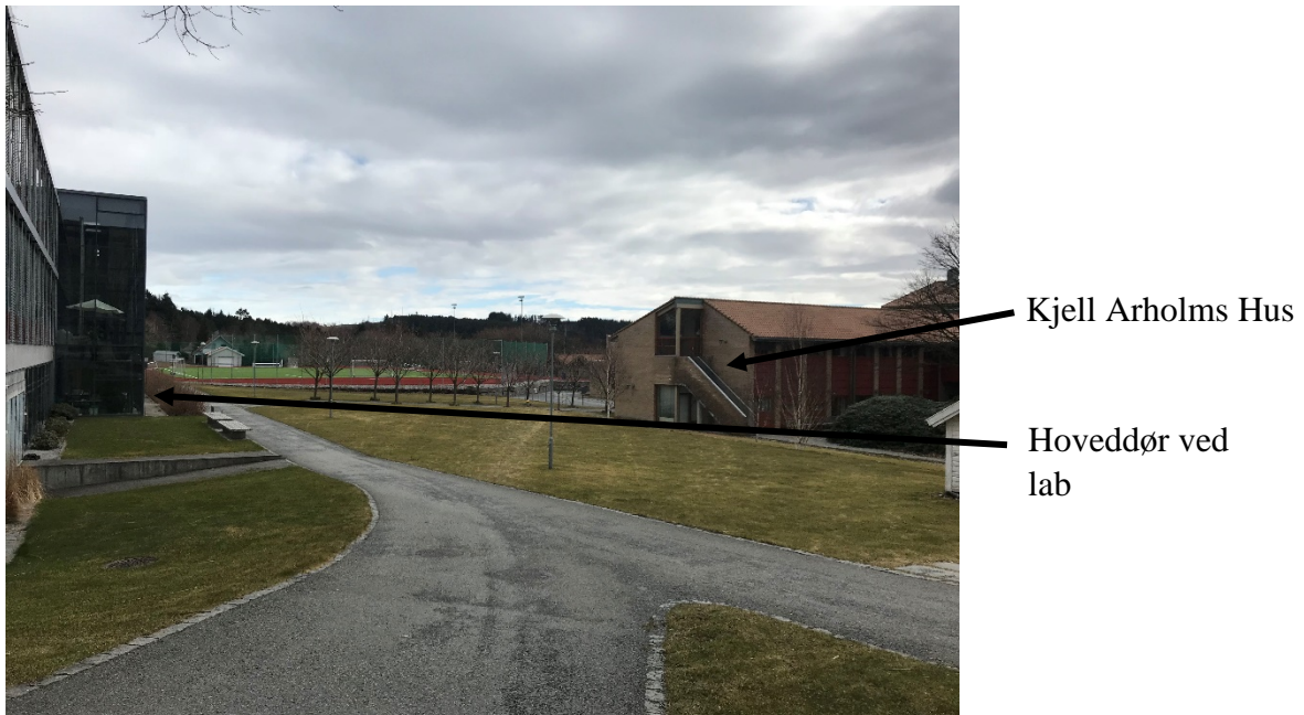
Bilde 2.2: Området mellom Hagbard Line-huset og Kjell Arholms Hus

kjemikaliene sammen i en plastikkskål på arbeidsbenken til høyre lengst fremme i biologilaben (se kart 2.1). Blandingen ble flyttet over i en pappbeholder og tatt med ut gjennom hoveddøren til området mellom HL-huset og Kjell Arholms hus. Noen av elevene kledde på seg ytterjakker og ble med ut for å observere, mens andre ble igjen i laboratoriet for å arbeide videre med sine respektive arbeidsoppgaver. Pappbeholderen ble festet i et metallstativ og det ble lagt inn en lunte til blandingen. Elevene stod på avstand, faglærer tente lunten, og blandingen brant som planlagt med en rød flamme, men smellet uteble.