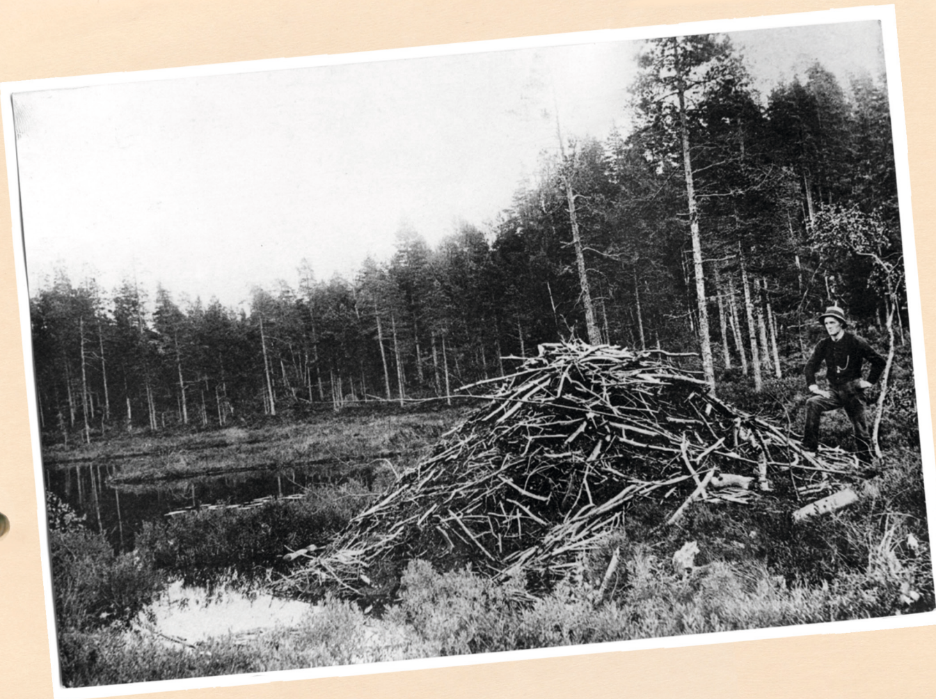
”Det här är en bild av våra förfäders hem i Åmli i Norge. År 1895, då bilden togs, fanns det inga bävvar alls i Sverige.”